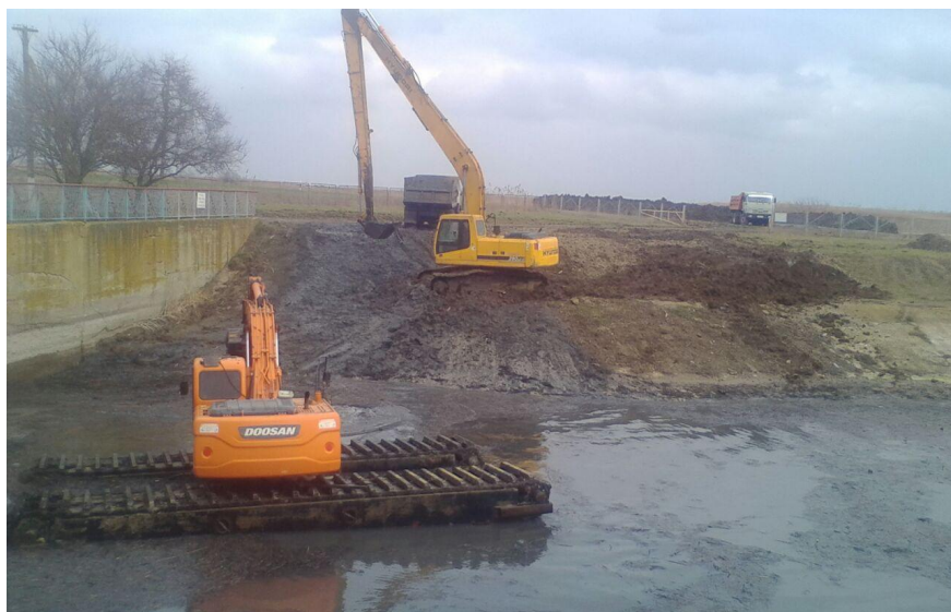
Межхозяйственный осушительный канал от ПК 17+50 до ПК 18+21 Понуро-Калининской оросительной системы, Калининский район