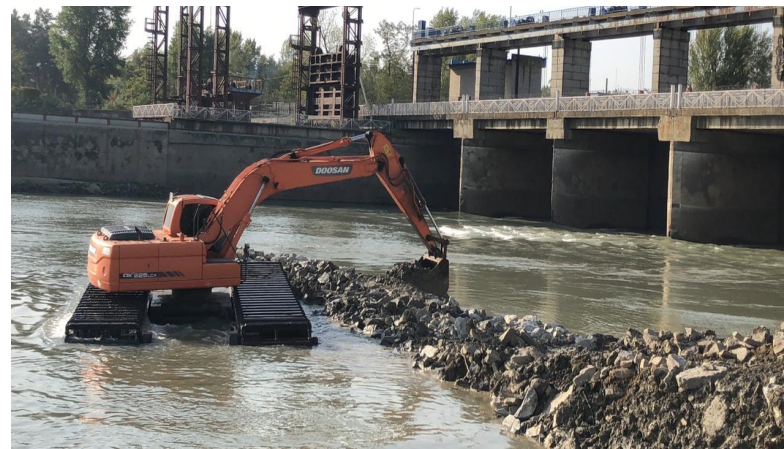
Восстановление проектных отметок каменного крепления верхнего бьефа плотины Федоровского подпорного гидроузла на р.Кубань, х.Прикубанский, Красноармейский район.